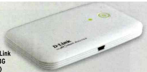
Routeur D-Link MyPocket 3G (250 euros)